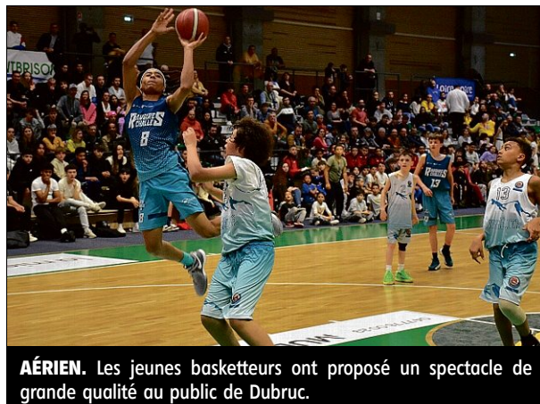
AÉRIEN. Les jeunes basketteurs ont proposé un spectacle de grande qualité au public de Dubruc.