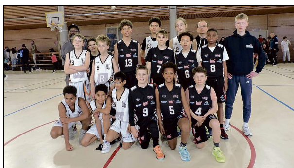
AUTRES VAINQUEURS. Écully a battu Annemasse 45 à 39 au terme d'un match d'une grande intensité, samedi soir au gymnase Soleillant, dans le cadre de la finale du tournoi Made in Loire.