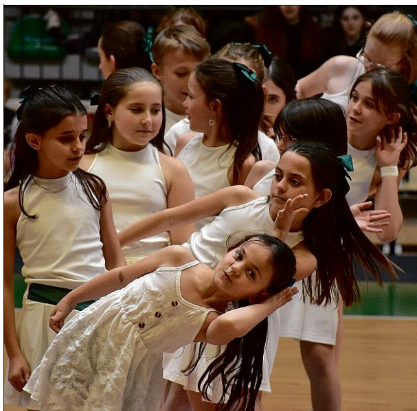
CHORÉGRAPHIES. Les BC Cheers ont parfaitement assuré le spectacle pendant les mi-temps.