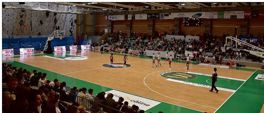
ÉQUIPEMENT. Le gymnase Dubruc affichait complet, dimanche après-midi à l'heure de la finale.