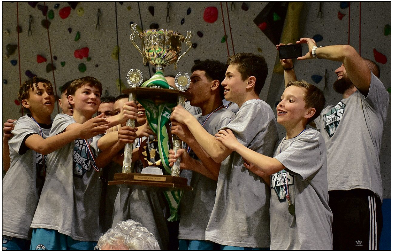
VAINQUEURS. Les moins de 13 ans saoyards de La Ravoire ont dominé tous leurs adversaires pour leur première participation.